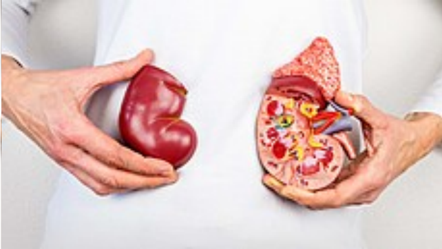
Ledvinám nevěnujeme dost pozornosti, říká lékař po dramatické transplantaci