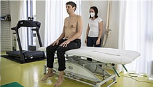
Tělo si vše pamatuje. Špatně chodíme, stojíme i dýcháme. Jak to poznat

Přečtěte si další exkluzivní články z IDNES Premium