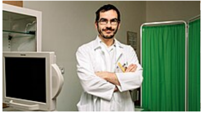
V léčbě rakoviny jsme na pomezí mezi Východem a Západem, říká onkolog