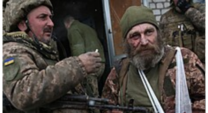
Jak zvládnout úzkost z invaze? Každý člověk je jiný, ale přinášíme několik univerzálnějších rad